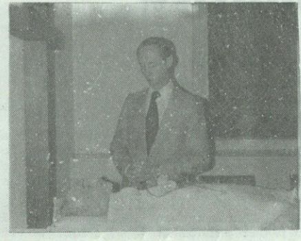
Feretro de D. Javier de Borbón Parma, junto a él su hijo D. Carlos-Hugo.

El 7 de Mayo, sábado, a las 9 de la mañana falleció don Javier de Borbón Parma. A los 88 años, en Suiza, en el exilio. Era la víspera de Montejurra. Nuestro viejo Rey murió lejos de su patria, lejos de los carlistas. Pero su venerable figura, como dijo el Secretario General del Partido Carlista en Javier, "va inmaculada a la tumba". Porque don Javier de Borbón Parma fué un luchador incansable de la libertad, la paz y la democracia, fué un gran luchador antifascista, fué el gran impulsor de la evolución del Partido hacia las actuales posiciones socialistas. Y el pueblo carlista, en aquel emotivo Montejurra-Javier, demostró su afecto y su respeto: boinas, banderas, pancartas lucían crespones y lazos negros.